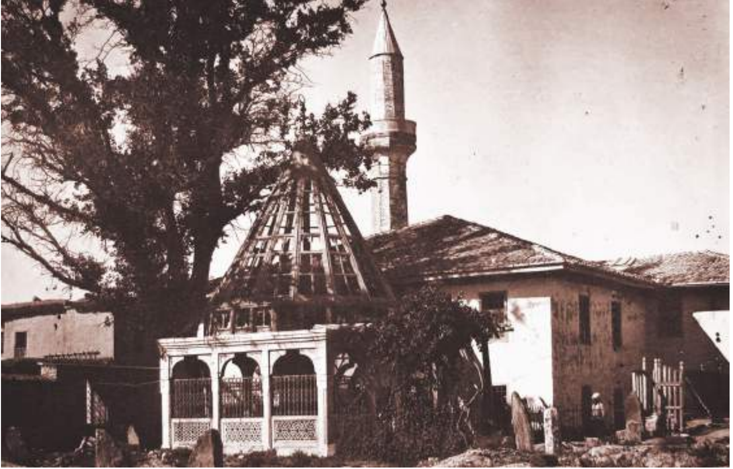
Sadreddin-i Konevi Türbesi ve camii

sonra Tanrı sizlere şifâlar versin, âşıkla mâşuk arasında bir kıl gömlekten başka bir şey kalmadı. Bunu da soyup çıkarmalarını ve nûrun nûra kavuşmasını istemiyor musunuz?” Sadreddin yanındakilerle birlikte gözyaşları dökerek ayrıldı.