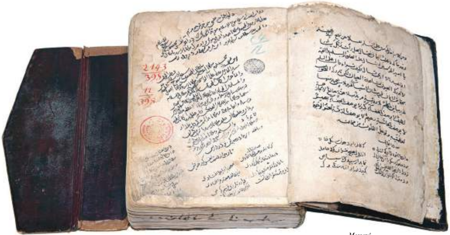
Mesnevî, Mevlânâ Müzesi

Gıyâbında ise daha bir saygı doludur. Sadreddin'den Mevlânâ'nın mânevî hâlleri sorulduğu vakit verdiği cevap, onun üçüncü hicri asrın iki meşhur sûfilerinden bile üstün olduğu şeklindedir. Der ki: "Eğer Bayezid el-Bistâmî (v. 261/874) ve Cüneyd el-Bağdâdî (v. 297/909) bu devirde yaşasalardı, bu Tanrı erinin atının eğer örtüsünü omuzlarında taşırlardı ve bu hizmeti canlarına minnet sayarlardı. Muhammed dininin fakirlik sofrası da odur, biz tufeyli gibi ondan istifâde ediyoruz."